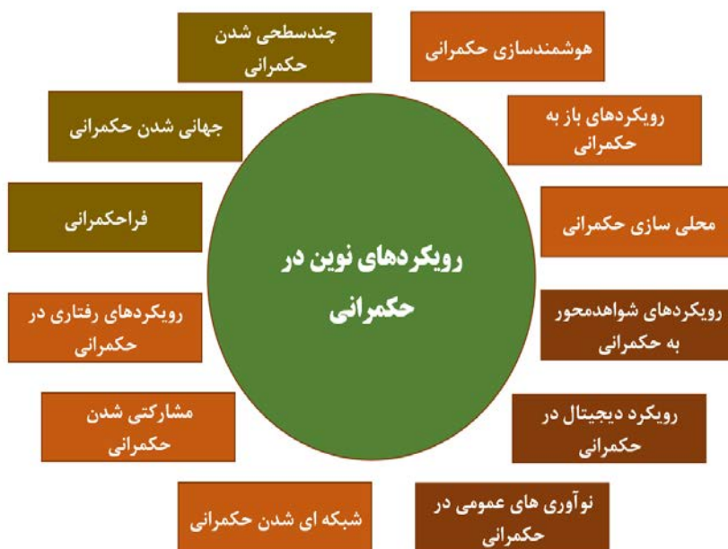
شکل ۲. رویکردهای نوین حکمرانی

جان تاملینسون این نکته را یادآور می‌شود که این حرکت تنها در قالب گذار از یک نظم محلی به نظم کلان نمی‌گنجد و نه تنها