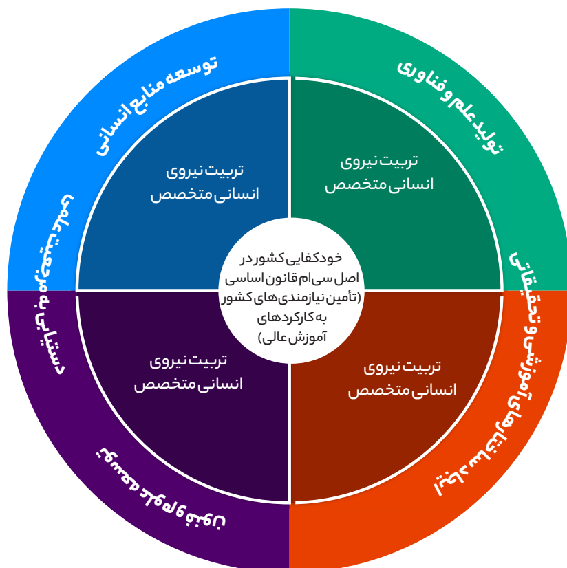
شکل ۳. ارتباط بین کارکردهای آموزش عالی و نقش آنها در تحقق خودکفایی کشور در اصل سی‌ام

این مطالعه ما را به چند یافته مهم رهنمون می‌کند: