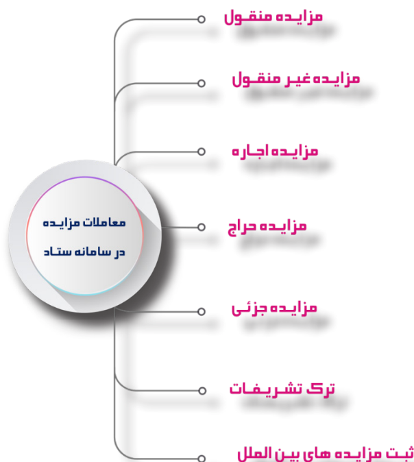
شکل ۲. انواع معاملات در سامانه مزایده ستاد