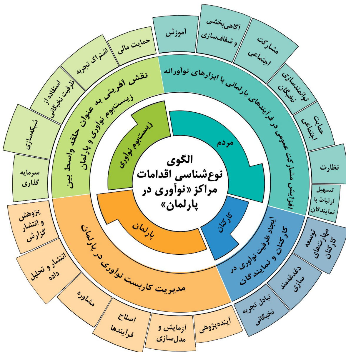
شکل ۴. چارچوب نوع‌شناسی اقدامات مراکز «نوآوری در پارلمان»

پس از بررسی اقدامات و استخراج و دسته‌بندی کارویژه‌ها و همچنین میزان فراوانی آنها در مراکز نوآوری مورد بحث، می‌توان چارچوبی را برای نوع‌شناسی اقدامات معطوف به پارلمان در این مراکز ترسیم کرد. این چارچوب دارای سه سطح است. سطح