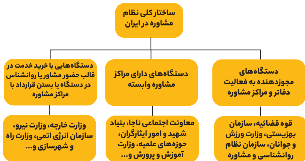
شکل ۱. ساختار کلی نظام مشاوره

بنابراین برای شناسایی، رصد و تحلیل وضعیت مشاوره خانواده در ایران، ابتدا با بیش از ۳۰ سازمان یا دستگاه اجرایی، آموزشی و ... نامه نگاری شد. نگاهی به پاسخننامه های ارسالی نشان می دهد ۱ که ساختار خدمات دهی روان شناسی و مشاوره به خصوص مشاوره خانواده (قبل، حین و پس از تشکیل آن) در ایران ترکیبی از سازمان ها یا دستگاه هایی است که: ۱. قوانین مجلس صراحتاً امکان مجوز دهی آنها را به افرادی که قصد ارائه خدمات مشاوره در چارچوب دفاتر یا مراکز رادارند تصویب کرده؛ ۲. سازمان ها یا دستگاه هایی که تحت شمول قوانین مصوب نبوده با داشتن تفاهمنامه با سازمان ها یا دستگاه های مجوز دهنده یا بدون داشتن آن براساس سیاست های مرتبط و یا با توجه به احساس نیاز برای جامعه هدف ذیل سازمان یا دستگاه اقدام به ایجاد مرکز یا مراکز خدمات مشاوره ذیل سازمان یا دستگاه مرتبط کرده اند؛ ۳. سازمان ها یا دستگاه ها با خرید خدمت از خدمات مشاوره ای در محل سازمان یا دستگاه و یا بستن قرارداد با مراکز معتبر مشاوره ای برای جامعه هدف ذیل سازمان یا دستگاه بهره مند می شوند. به این ترتیب چهار سازمان یا دستگاه اصلی مجوز دهنده براساس قانون و بیش از ۱۰ سازمان یا دستگاه دارای مراکز مشاوره در راستای خدمات دهی به جامعه هدف ذیل سازمان یا دستگاه و یا عموم شهروندان شناسایی شدند. این ساختار را می توان با تعبیر دیگری توصیف کرد؛ نظام موجود و خدمات رسانی مشاوره و روان شناسی در ایران به شدت چندپاره و بیش از ۱۴ سازمان یا دستگاه ترکیب یافته است. در شکل ۱ تصویری کلی از این ساختار نشان داده شده است.