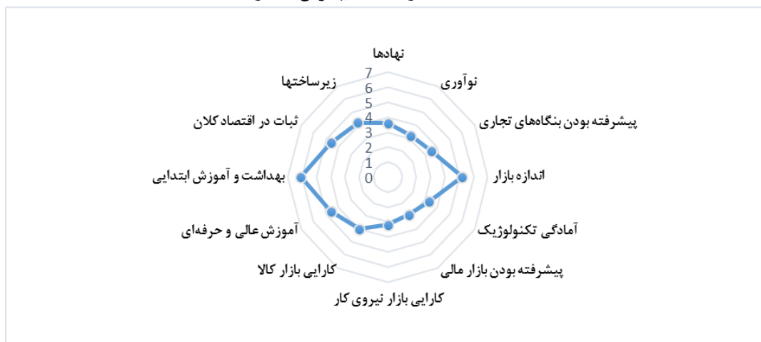
نمودار ۱. امتیاز ارکان رقابت‌پذیری ایران در گزارش ۲۰۱۶-۲۰۱۷ رقابت‌پذیری جهانی، (امتیاز ۱-۷، ۷ بهترین امتیاز)

معاونت پژوهش‌های اقتصادی دفتر: مطالعات اقتصادی