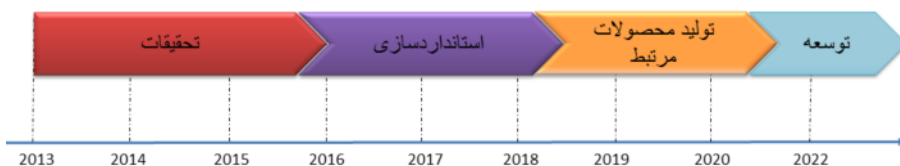
شکل ۲. نقشه راه اتحادیه اروپا برای فعالیت در حوزه نسل پنجم

طبق گزارش‌های منتشر شده، این سازمان قصد دارد بین سال‌های ۲۰۱۴ تا ۲۰۲۰ میلادی در بخش تحقیق و توسعه برای فناوری یاد شده ۷۰۰ میلیون دلار هزینه کند. (۱۵)