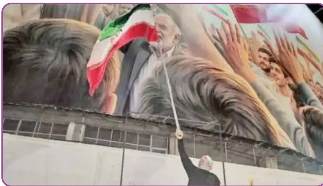
شکل ۱. برافراشته نگه داشتن پرچم ایران در میدان حضرت ولی عصر (عج)

ثبت محل اهتزاز پرچم/محل سخنرانی/پرچم ملی از جمله ثبت‌های مسبوق به سابقه در ایالات متحده آمریکا، پاکستان، روسیه و هند است [۶]. به‌طور مشخص ایالات متحده در سال (۱۹۳۹) دژ مک‌هنری ۱ در بالتیمور را به‌عنوان نماد پایداری ملی و الهام‌بخش سرود ملی ثبت و حفاظت کرد. پاکستان نیز مناره لاهور را که محل تصویب قطعنامه تشکیل پاکستان و محل برافراشته شدن پرچم ملی در مراسم رسمی است، به‌عنوان نماد هویت و استقلال ملی ثبت کرده است. در روسیه نیز پرچم پیروزی برافراشته شده بر فراز رایشس‌تاگ ۲ به نماد پایان جنگ جهانی دوم تبدیل شده و در موزه مرکزی نیروهای مسلح مسکو ۴ نگهداری می‌شود [۷]. همچنین در هند برخی از پرچم‌های اولیه دوران استقلال به‌عنوان اسناد تاریخی در آرشیو ملی دهلی نو ۵ حفاظت می‌شوند [۸].