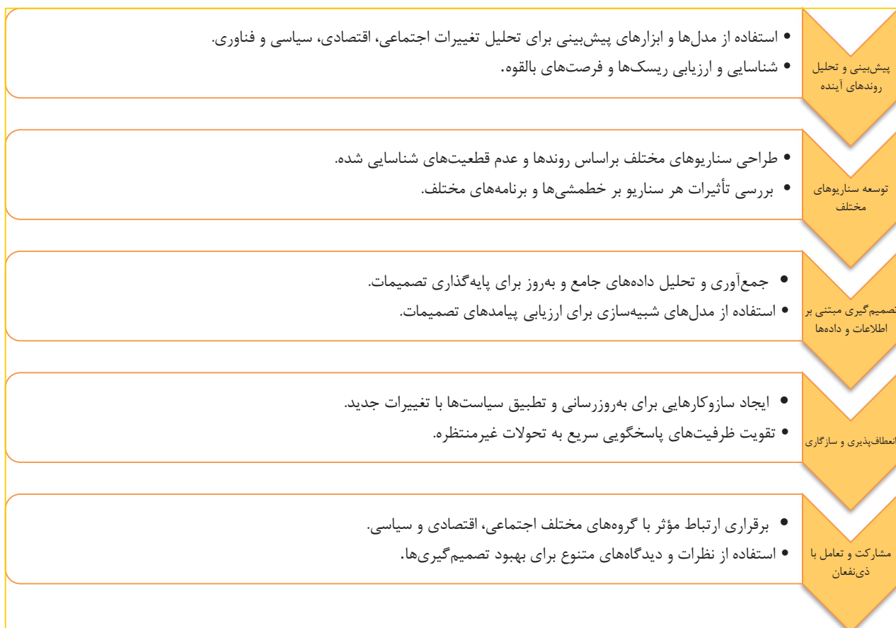
شکل ۱. مراحل اجرای حکمرانی پیش‌نگر [۲۴]

مراحل اجرای حکمرانی پیش‌نگر را می‌توان بر اساس مراحل ذیل خلاصه کرد که در شکل زیر نشان داده شده است [۲۴].