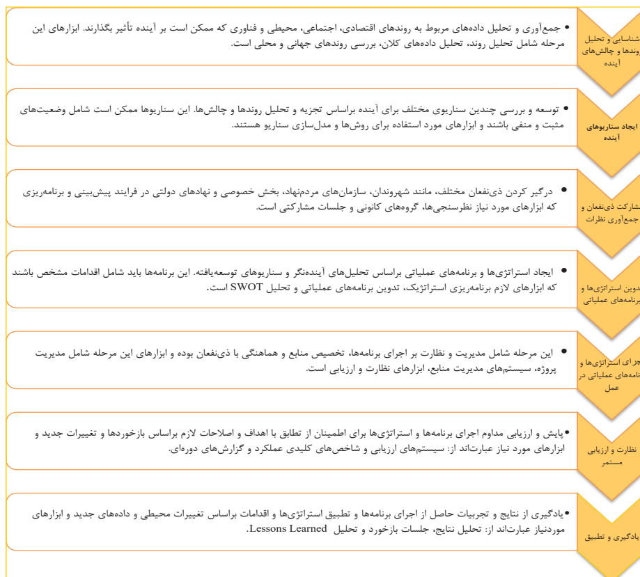
شکل ۲. فرایندهای اجرای حکمرانی پیش‌نگر [۳۷ و ۳۸]