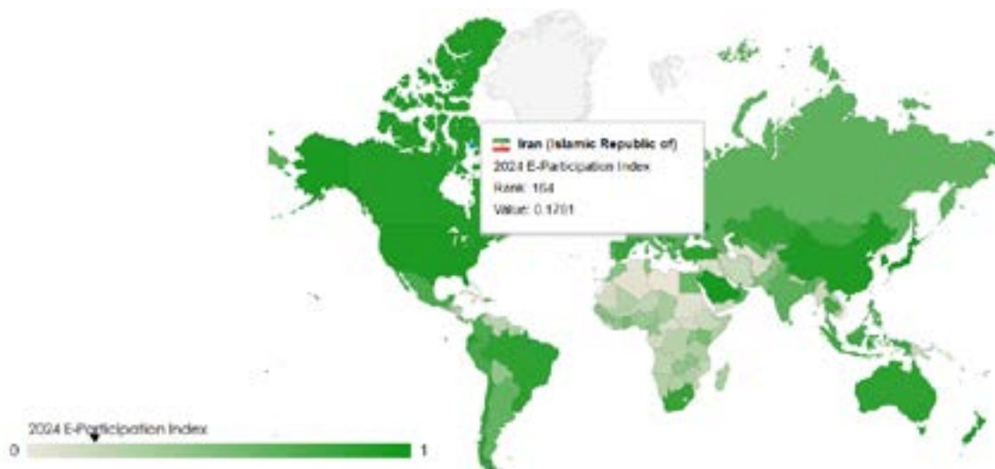
شکل ۱. شاخص مشارکت الکترونیکی برای ایران در سال ۲۰۲۴ [۴]

با این حال، در زمینه ارائه خدمات دولتی برخط، ایران در جایگاه نسبتاً پایینی قرار دارد. این رقم نشان‌دهنده این است که خدمات دولتی به صورت برخط ممکن است به خوبی در دسترس نباشند و پیچیدگی‌هایی در ارتباط با دسترسی به آنها وجود داشته باشد. نبود بستر قوی برای ارائه خدمات برخط می‌تواند به مشارکت کمتر مردم در فرایندهای حکومتی منجر شود.