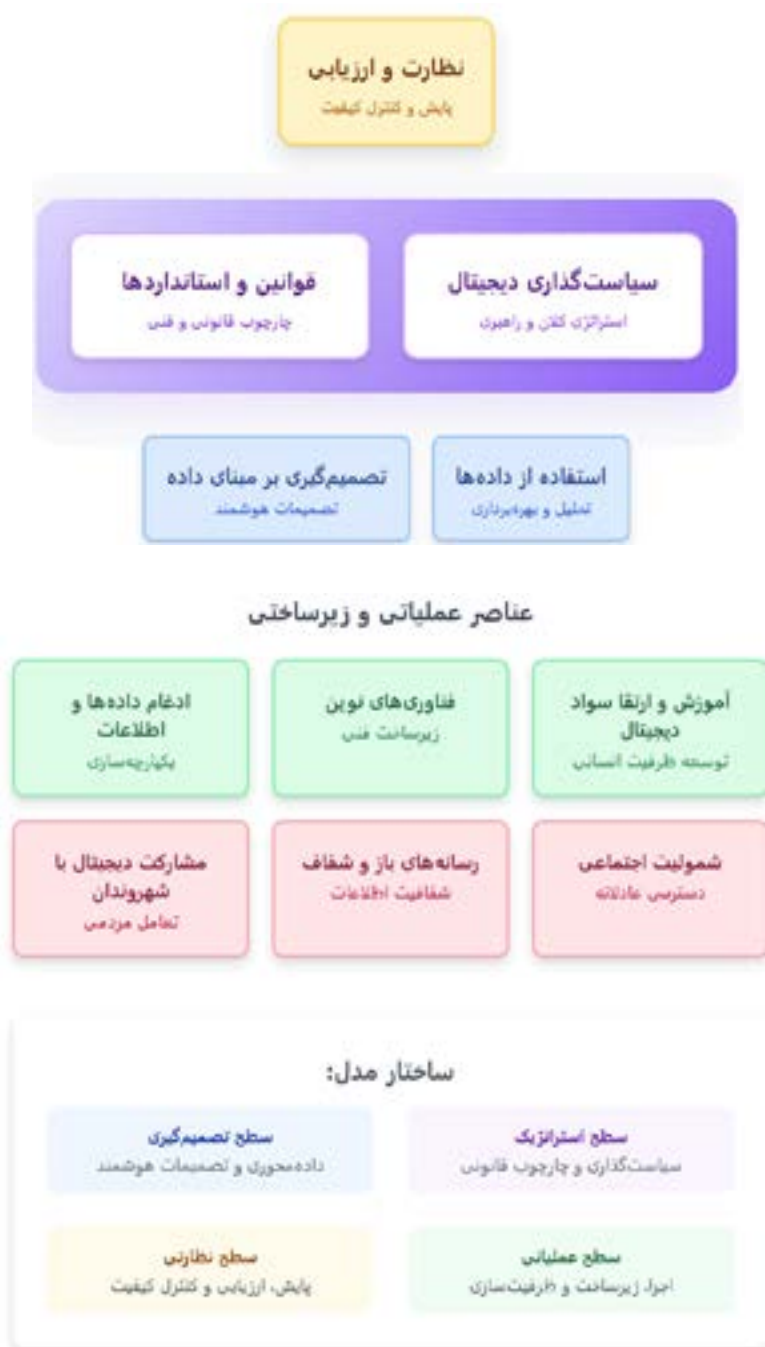
شکل ۶. عناصر ضروری برای تحقق تحول دیجیتال در مجلس شورای اسلامی

بررسی چارچوب‌های طراحی شده توسط اسناد علمی و تمرکز عملیاتی پارلمان‌ها بر تحقق تحول دیجیتال نشان از آن دارد که حرکت به سمت این نوع پارلمان نیازمند تمرکز بر عناصری است که شکل ۶ ارائه شده است. بر مبنای عناصر مذکور و ساختار مجلس شورای اسلامی در اقدام‌ها و متولیان پیشنهادی برای تحقق تحول دیجیتال در جدول ۶ ارائه شده است.