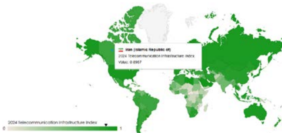
شکل ۳. شاخص ساختار ارتباطاتی برای ایران در سال ۲۰۲۴ [۴]

وضعیت ایران در زمینه فناوری، زیرساخت‌های مخابراتی و ارائه خدمات برخط نشان‌دهنده نقاط قوت و ضعف‌های قابل توجهی است. در حالی که زیرساخت‌های مخابراتی در وضعیت خوبی قرار دارند، بقیه شاخص‌ها نیاز به توجه بیشتری دارند. برای بهبود وضعیت مشارکت الکترونیکی و خدمات برخط، باید بر توسعه زیرساخت‌های دیجیتال، افزایش دسترسی به فناوری و ارتقای خدمات دولتی برخط تمرکز شود. ایجاد بسترهای بیشتر برای مشارکت عمومی و تعامل فعال میان دولت و مردم می‌تواند نقشی کلیدی در بهبود شرایط حکمرانی دیجیتال در ایران ایفا کند. از این رو، بررسی تجارب جهانی در گذر از این چالش‌ها می‌تواند نقشه راهی را برای ارتقای مؤلفه‌های کلیدی پارلمان دیجیتال فراهم آورد.