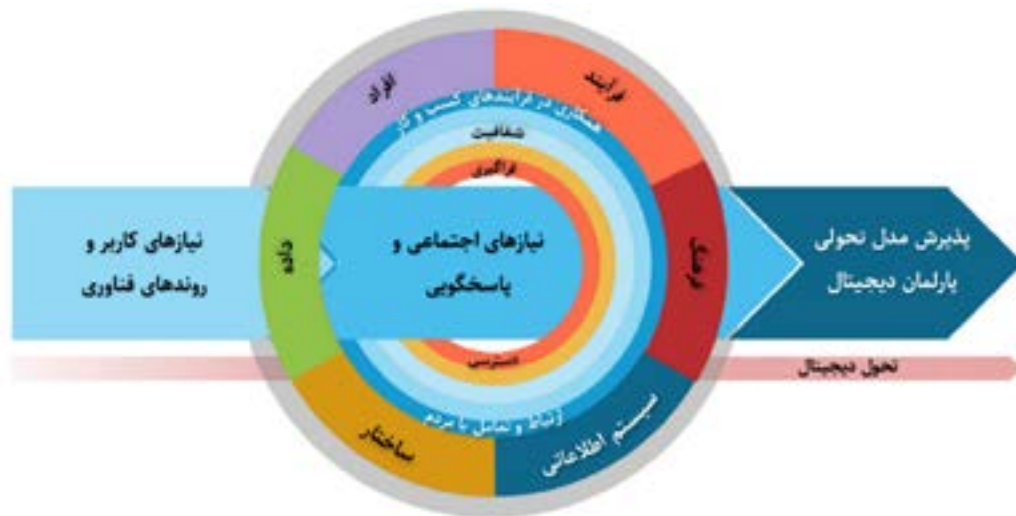
شکل ۵. چارچوب تحول پارلمان دیجیتال کرزیس [۳۰]

به‌طور کلی، ادبیات موجود در زمینه طراحی چارچوبی برای تحقق تحول دیجیتال در پارلمان‌ها اندک است و بیشتر شامل تعداد کمی از راهبردهای دیجیتال منتشر شده توسط پارلمان‌هاست که تلاش می‌کنند عناصر تحول سازمانی را با فناوری‌های دیجیتال در ساختاری چندلایه تلفیق کنند. با این حال، برای فضای کاری پارلمانی، بیش از یک بستر ساده با ابزارها و نرم‌افزارهای یکپارچه لازم است، به‌ویژه در مرحله تدوین سیاست که تعداد زیادی کاربر، مانند بازیگران پارلمانی و یا ذی‌نفعان، معمولاً درگیر هستند. با این وجود، ابزارهای یکپارچه مبتکرانه و پیشرفته مانند خدمات مشارکت الکترونیکی، کمپین‌های رسانه‌های اجتماعی، تصویرسازی‌ها و تحلیل‌های زبانی، پتانسیل پیشبرد تحول دیجیتال چرخه سیاستگذاری را دارند.