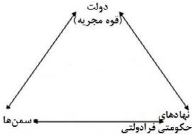
شکل ۱. نمودار گونه‌شناسی کنشگران نهادی در حوزه محرومیت‌زدایی