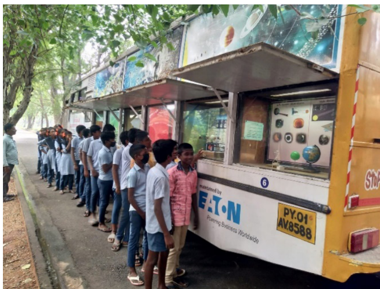
شکل ۲. تصویر یک نمونه موزه سیار در هند [۲۱]

کشور هند نشان می‌دهد که کاربست الگوهای روایتگری خلاق، صرفاً در نظر گرفتن هزینه‌های زیاد نیست و می‌توان با ابزارهای خلاقانه، مسیر توجه به روایتگری خلاق در موزه‌ها را به خوبی طی کرد.