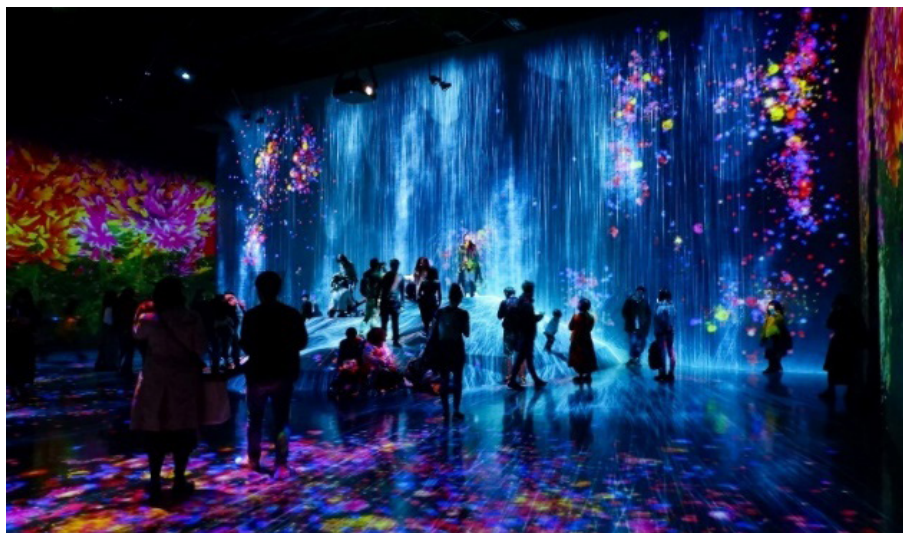
شکل ۱. تصویر موزه تیملب بُردرلس در ژاپن [۲۰]

آموزش به جامعه، هدف توسعه موزه را با نقش آموزشی و فرهنگی تصریح کرده است؛ پیش از این چارچوب، موزه‌ها بیشتر شیء محور ارزیابی می‌شدند، اما پس از تثبیت موزه به منزله نهاد آموزش اجتماعی، طراحی تجربه و تفسیر مخاطب محور مشروعیت و پشتوانه نهادی پیدا کرد. از نظر کاهش خطر در بحث نمایش‌ها و بیمه آثار، طرح تضمین دولتی آثار هنری ۱ که در ۲۰۱۱ استقرار یافت، هزینه بیمه امانت‌های خارجی را پایین آورد؛ قبل از آن، بیمه سنگین مانع نمایش‌های بزرگتر با حضور آثار بیشتر بود، اما پس از این طرح، امکان امانت‌گیری برای تکمیل روایت‌های تعاملی بیشتر شد و تنوع نمایش‌ها بالا رفت [۱۵]. نقطه قوت ژاپن همسویی در نظر گرفتن نقش آموزشی برای موزه با ابزارهای تعاملی است و چالش‌های اصلی، نگهداشت پرهزینه و احتمال خستگی حسی مخاطبان بر اثر درگیری بیش از حد حواس‌شان است که با طراحی مسیرهای جایگزین و ایجاد استانداردهای دسترس‌پذیری برای روایتگری خلاق برای انواع گروه‌های مخاطب نظیر سالخورده‌گان و کودکان قابل مدیریت است. به‌طور کلی تجربه حاضر نشان داد توجه به کاربست الگوهای روایتگری خلاق زمانی تکمیل می‌شود که موزه‌ها به امر آموزش و ارتباط با نهادهای آموزشی توجه کنند. همچنین در این تجربه جهت کاهش هزینه‌های نورپردازی و رقومی از موارد خلاقانه‌ای نظیر آیینه‌کاری استفاده شده است.