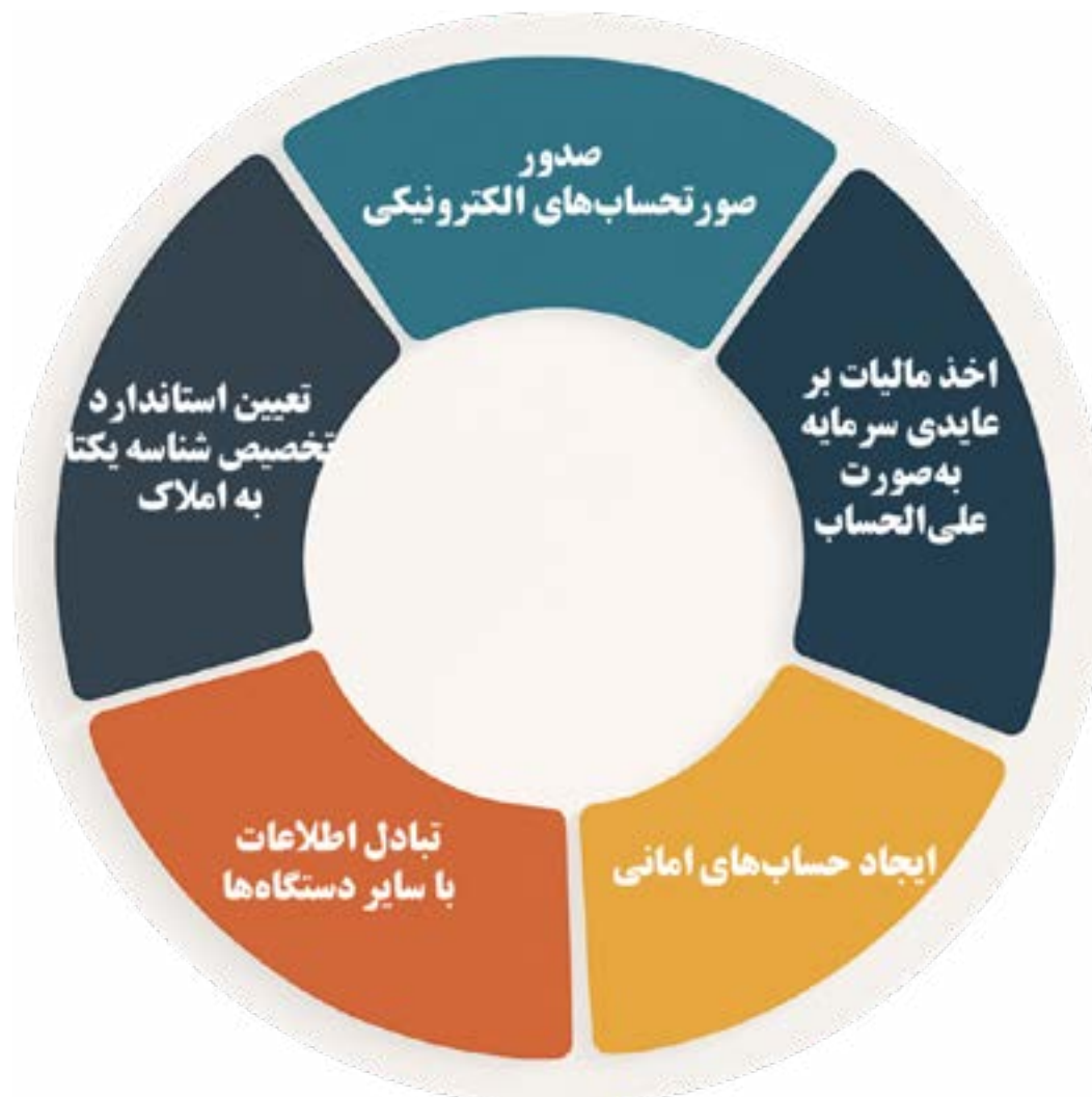
شکل ۱. تکالیف سازمان ثبت اسناد و املاک کشور بر اساس قانون مالیات بر سوداگری و سفته‌بازی

در قانون مالیات بر سوداگری و سفته‌بازی [۱]، «سازمان ثبت اسناد و املاک کشور» تکالیف متعددی در خصوص صدور صورتحساب الکترونیکی و ارسال آن به سازمان امور مالیاتی کشور را بر عهده دارد که در این بخش تشریح شده است. تکالیف سازمان ثبت اسناد و املاک کشور، عمدتاً از طریق دفاتر اسناد رسمی به عنوان بازوی اجرایی و عملیاتی سازمان ثبت اسناد و املاک کشور انجام می‌شود. در ادامه هر یک از این تکالیف به تفکیک، تشریح می‌شوند. همان‌طور که در شکل ۱ مشاهده می‌شود، این تکالیف در پنج محور اصلی دسته‌بندی شده‌اند که در ادامه هر یک به تفکیک تشریح خواهند شد.