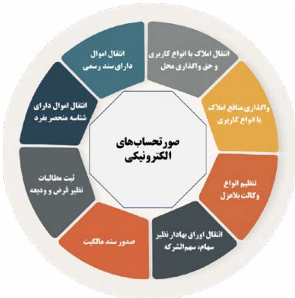
شكل ۲. انواع صورتحساب‌هاى الكترونيكي براساس تحليل تكاليف سازمان ثبت اسناد و املاك كشور

مطابق ماده (۱۶ مكرر) قانون پايانه‌هاى فروشگاهاى و سامانه مؤديان [۳]، سازمان ثبت اسناد و املاك كشور در مواردى مطابق شكل ۲ موظف است نسبت به صدور صورتحساب الكترونيكي اقدام كند. اين تكاليف، عمدتاً از طريق دفاتر اسناد رسمى به‌عنوان واحدهاى اجرايى وابسته به سازمان ثبت اسناد و املاك كشور انجام مى‌شود و اطلاعاتى نظير قيمت معامله، تاريخ انجام معامله و اطلاعات هويتى طرفين را در قالب صورتحساب الكترونيكي براى سازمان امور مالياتى كشور ارسال مى‌كنند.