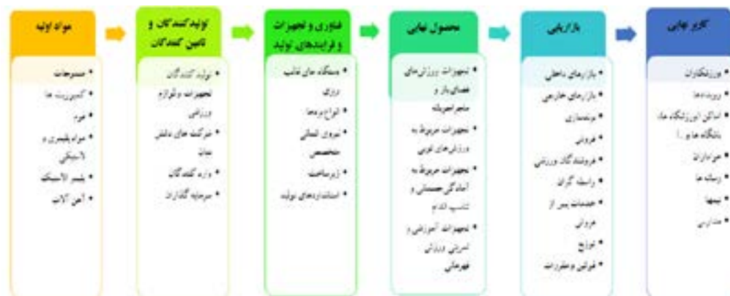
شکل ۱. زنجیره ارزش صنعت لوازم و تجهیزات ورزشی

امروزه کشورها و شرکت‌های مختلفی در راستای توسعه صنایع، به بررسی زنجیره ارزش صنعت مربوطه اقدام می‌کنند. زنجیره ارزش، به فرایندهایی می‌گویند که ارزش به محصول یا خدمات اضافه می‌شود و شامل فعالیت‌هایی از قبیل ایده‌پردازی، طراحی، تولید، توزیع و فروش و خدمات پس از فروش می‌شود [۳]. این زنجیره به‌عنوان یک الگوی مفهومی نشان می‌دهد که چگونه سازمان می‌تواند با بهینه‌سازی فعالیت‌ها و بهره‌وری در هر مرحله، برتری رقابتی را به دست آورد و ارزش بیشتری برای مشتریان ایجاد کند [۴]. با بررسی مراحل و فرایندهای مختلف صنعت لوازم و تجهیزات ورزشی در کشور، می‌توان ۶ بخش مهم را برای زنجیره ارزش این صنعت در نظر گرفت (شکل ۱).