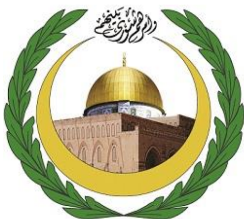
شکل ۱. نشان اتحادیه بین‌المجالس اسلامی

را پررنگ‌تر کند. به طوری که یکی از موضوع‌های مهم اجلاس‌های اتحادیه بین‌المجالس اسلامی، همواره نحوه دفاع از حقوق ملت مظلوم فلسطین در برابر تجاوزهای رژیم صهیونیستی بوده است که می‌توان مصداق آن را در تصویر مسجد الاقصی در وسط لوگوی اتحادیه بین‌المجالس اسلامی مشاهده کرد. در لوگوی این اتحادیه آیه ۳۸ سوره شوری، وَأَمْرُهُمْ شُورَى بَيْنَهُمْ نیز درج شده است.