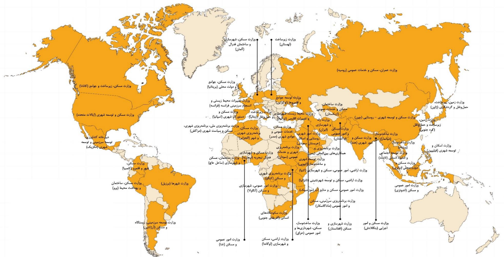
شکل ۲. اسامی وزارتخانه‌های موضوع مسکن و شهرسازی در ۵۰ کشور بر جمعیت جهان