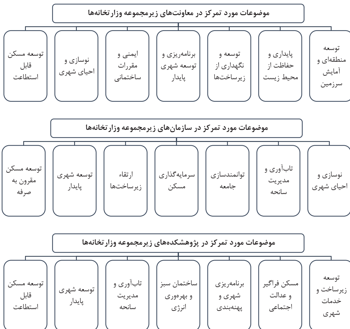
شکل ۳. حوزه‌های تمرکز زیرمجموعه‌های وزارتخانه‌های موضوع مسکن و شهرسازی در ۳۸ کشور پرجمعیت دنیا

در این گام با مراجعه به تارنمای وزارتخانه‌ها، معاونت‌ها، سازمان‌ها و پژوهشکده‌های مورد مطالعه و مرور اجمالی بر اسناد و برنامه‌های بارگذاری شده در آنها، ابتدا موضوع‌های مورد تمرکز هر یک استخراج شده و سپس با تکیه بر آنها و مرور تجارب و اقدام‌های صورت گرفته در نهادهای سه‌گانه، ۱۱ مأموریت کلان وزارتخانه مربوط به موضوع مسکن و شهرسازی شناسایی و تدوین می‌شود.