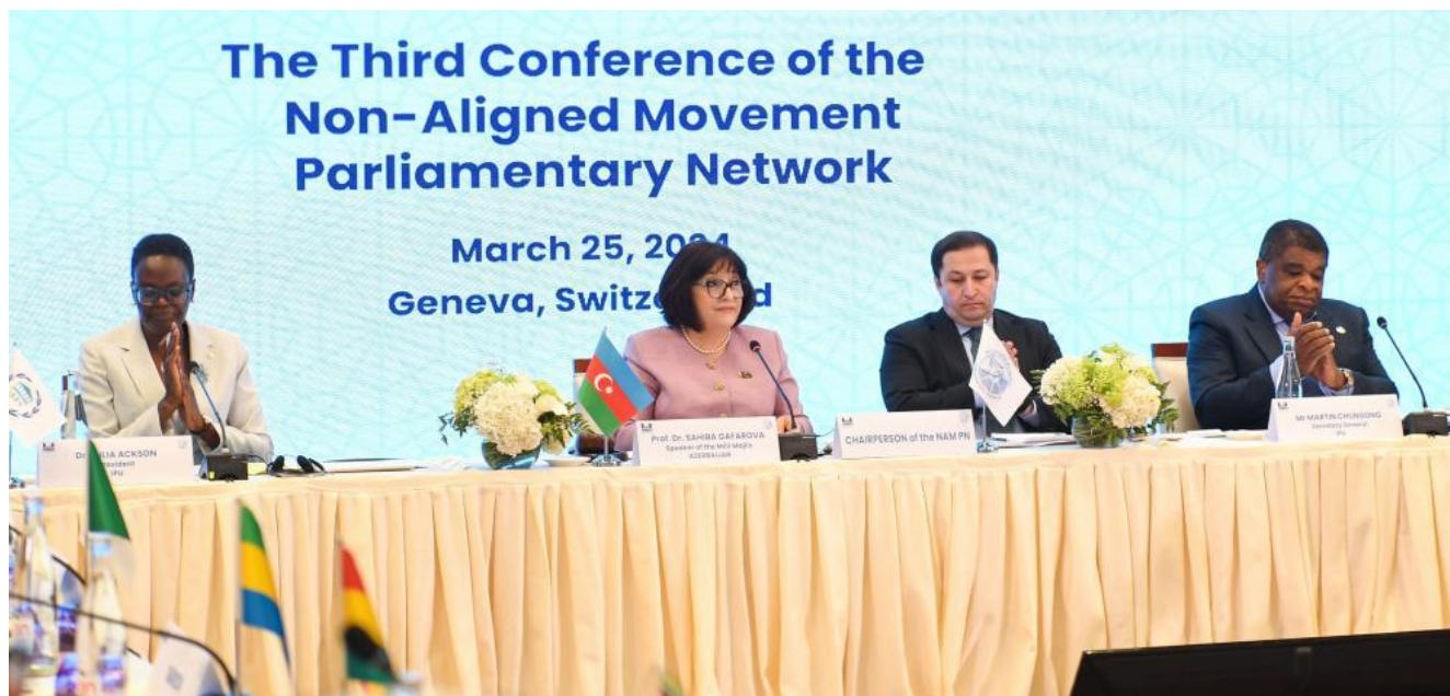
شکل ۶. سومین کنفرانس شبکه پارلمانی جنبش عدم تعهد [۱۸]

دیپلماتیک مجلس دوازدهم لازم است با اتخاذ دیپلماسی فعال پارلمانی، بستر میزبانی از نشست‌های منطقه‌ای اتحادیه بین‌المجالس جهانی که در آنها رژیم صهیونیستی عضویت ندارد را فراهم کند. این اقدام به پیشرفت منطقه‌گرایی پارلمانی و تحکیم روابط پایدار بین مجالس آسیایی نیز کمک می‌کند.