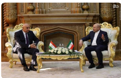
رایزنی دیپلماتیک رئیس مجلس دوازدهم با محمدطاهر ذاکرزاده، رئیس مجلس نمایندگان تاجیکستان