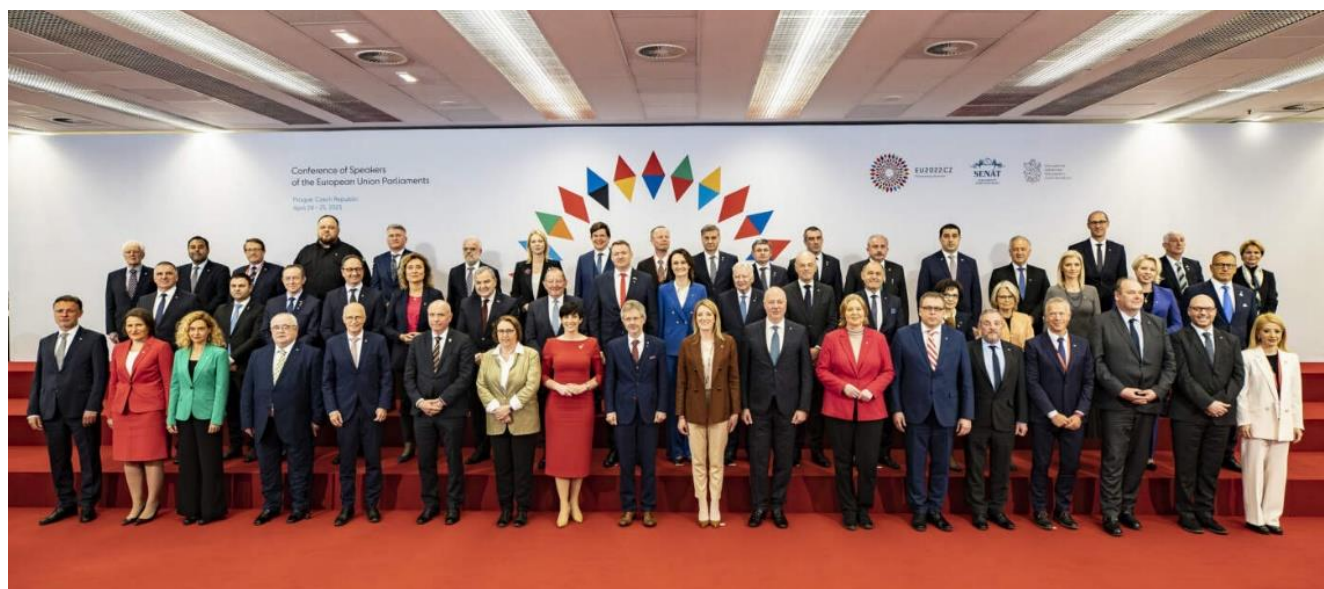
شکل ۱. پنجاه و دومین اجلاس سالیانه رؤسای هیئت‌های دیپلماتیک پارلمانی اتحادیه اروپا در پراگ [۱۰]

غرب آفریقا» ۶ مصداقی از توجه حکمروایان قاره آفریقا به انتفاع حداکثری از پتانسیل دیپلماتیک رئیس پارلمان برای توانمندسازی جایگاه مجلس در حوزه سیاست خارجی است.