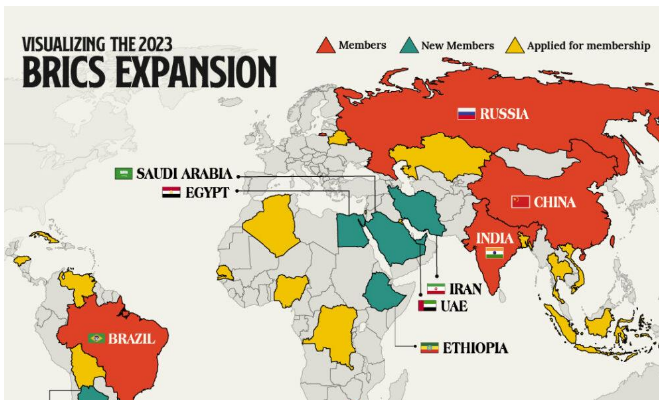
شکل ۴. گستره جغرافیایی مجمع پارلمانی بریکس [۱۶]

یکی از ملزومات مقابله با یک‌جانبه‌گرایی و تعمیق روابط پایدار با قدرت‌های نوظهور، عضویت جمهوری اسلامی ایران در «مجمع پارلمانی بریکس» است. «بریکس» گروهی از کشورها به رهبری قدرت‌های نوظهور اقتصادی است و عنوان آن کوتاه‌نوشتی است که از به هم پیوستن حروف اول نام انگلیسی آن کشورها یعنی برزیل، روسیه، هند، چین و آفریقای جنوبی ساخته شده است. در اجلاس بریکس در شهریورماه سال ۱۴۰۲ در آفریقای جنوبی، پنج عضو اصلی این گروه با عضویت جمهوری اسلامی ایران، عربستان