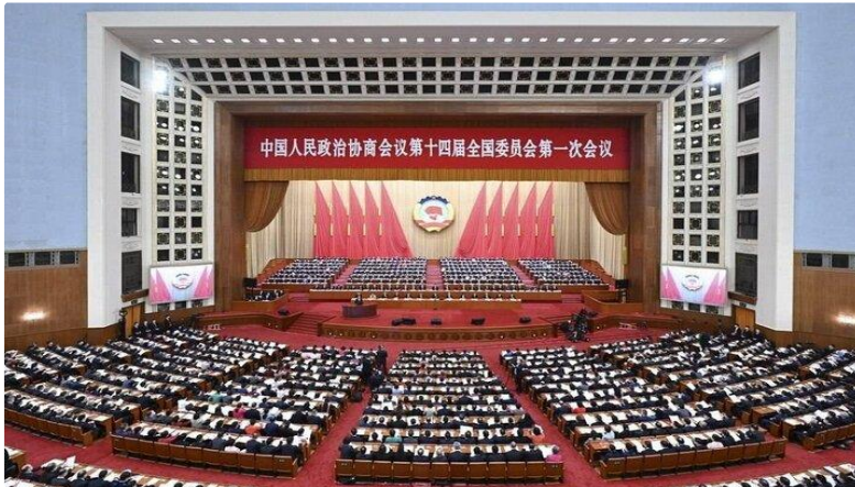
سالن بزرگ کنگره ملی خلق چین