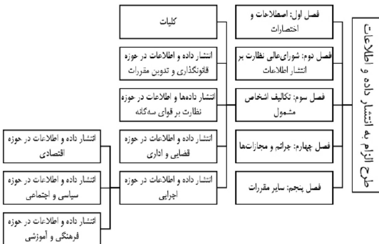
شکل ۳. سرفصل‌های اصلی طرح الزام به انتشار داده و اطلاعات

■ عدم مشخص بودن رابطه این لایحه با قوانین قبلی نظیر قانون انتشار و دسترسی آزاد به اطلاعات: ارتباط میان احکام خاص و مصداقی لایحه با احکام کلی قانون انتشار و دسترسی آزاد مشخص نشده و همچنین رابطه این لایحه و قانون انتشار و دسترسی آزاد به اطلاعات چه از لحاظ مفهومی و چه از لحاظ ساختاری و نهاد پیشنهادی مشخص نیست و این مسئله باعث تشتت در تصمیم‌گیری‌های مربوط به شفافیت و انتشار داده و اطلاعات در کشور خواهد شد.