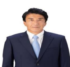
سائیتو کین ۹ وزیر اقتصاد، تجارت و صنعت