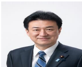
کی‌هارا مینوری ۱ وزیر دفاع