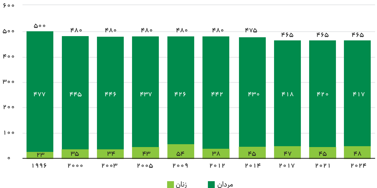
شکل ۱. نمودار تعداد قانونگذاران مجلس نمایندگان

نامزدهایی که بیشترین رأی را بیاورند می‌توانند متصدی مقام نمایندگی در مجلس نمایندگان باشند. طول مدت هر دوره این مجلس ۴ سال است، در حالی که دولت می‌تواند هر زمانی آن را منحل کند و خواستار انتخابات جدید شود.